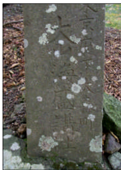
大山に奉納された海盛講の石碑

4月初めは成田山参詣、7月は武蔵御岳、大山阿夫利神社、富士講の富士登山などが海苔生産者の信仰を集めていました。参詣は地域の講の仲間で行われ、普通は大将（一家の年長者）が参加しましたが、中には「ワレ（お前）、行ってこいよ」と言われて年下の者が行く家もあったそうです。